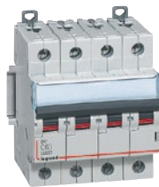
4 079 34

Соответствуют требованиям стандарта МЭК 60898-1