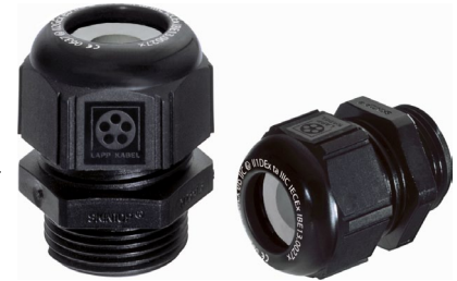
SKINTOP® K-M ATEX plus