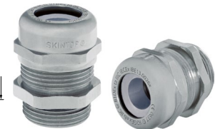
SKINTOP® MSR-M ATEX