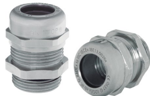
SKINTOP® MS-M ATEX